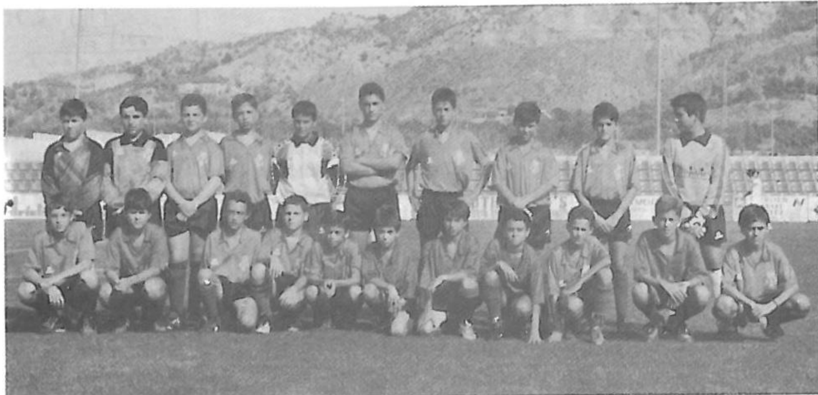
Infantiles PINOSO C.F.

Los equipos de fútbol base siguen sin obtener buenos resultados en las diferentes categorías. En el mes de diciembre hay que destacar al equipo cadete con esas dos victorias ante Murada y San Fulgencio, pero los chicos están creando muchos problemas a su entrenador que se muestra enfadado por la poca