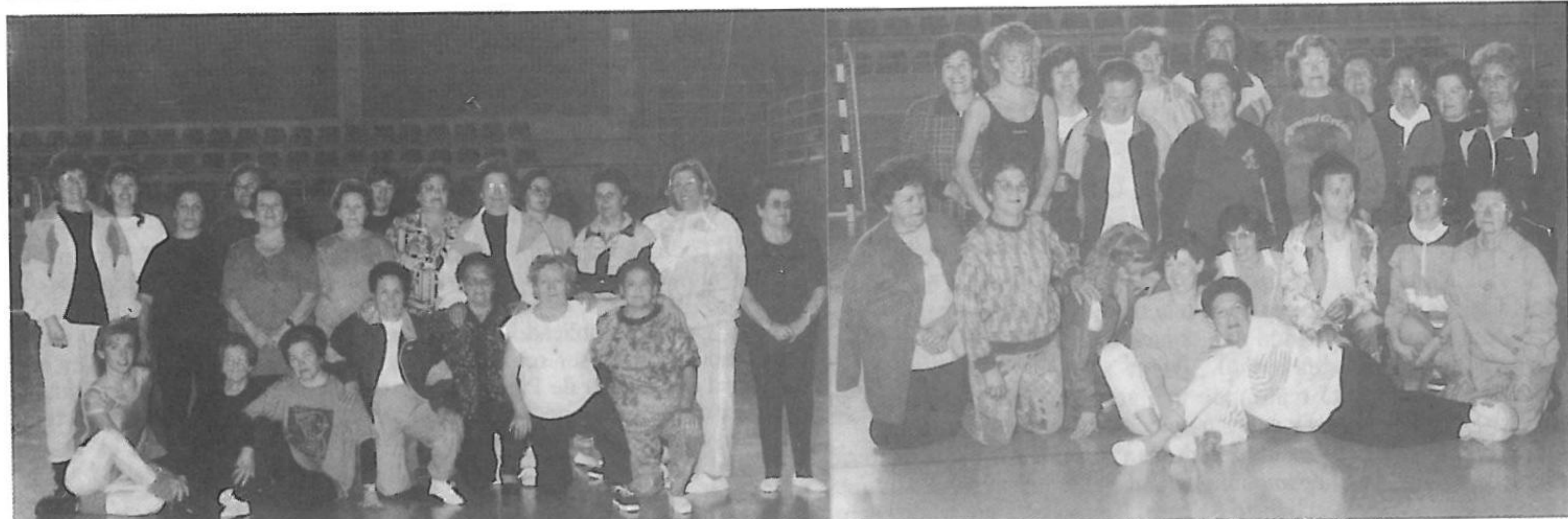
Cualquier edad es buena para hacer deporte, como ilustran estas fotos. Es posible que después de estas fiestas estos grupos se vean incrementados por culpa del turrón.